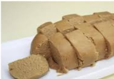
Pella de gofio.