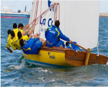
Vela latina canaria.